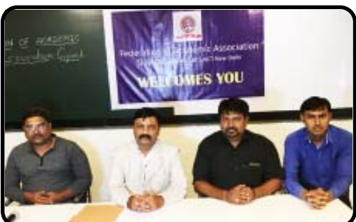
સત્યામંડળ દ્વારા અ સ ર ક ા ર ક કાર્યવાહી ન થતાં આખરે હાઈકોર્ટમાં પી આ ઈ એ લ કરવામાં આવી છે.

૨૦૦૨ના ટ્યુશન અધિનિયમન મુજબ સરકારી ગ્રાન્ટેડ અને નોન ગ્રાન્ટેડ શાળાના શિક્ષકો પ્રાઈવેટ ટ્યુશન કરાવી શકે નહીં, પરંતુ આ અધિનિયમનનો ખુલ્લેઆમ ઉલ્લંઘન થઈ રહ્યો છે અને શિક્ષકો સરકારી તંત્રના ડર વિના બેકામ ટ્યુશન ચલાવીને જંગી ફી વસૂલી રહ્યાં છે. વિશેષ કરીને ધોરણ ૧૦ બોર્ડની પરિક્ષામાં ૭૦ માર્ક્સની ગણતરીમાં લેવાય છે તથા બાકીના ૩૦ માર્ક્સ શાળા દ્વારા મુકવામાં આવે છે. શિક્ષકો આનો ગેરવાલ ઉઠાવીને વિદ્યાર્થીઓને તેમના ટ્યુશનમાં આવવા દબાણ કરે છે અને ટ્યુશનમાં ન આવતાં વિદ્યાર્થીઓને ઓછા માર્ક્સ આપવાની અથવા નાપાસ કરવાની ધમકી આપે છે. એવાં ઘણાં કિસ્સા પ્રકાશમાં આવ્યાં છે કે જેમાં ૭૦માંથી ૭૦ માર્ક્સ મેળવનાર વિદ્યાર્થી ઈન્ટર્નલમાં ઓછા ગુણ મેળવ્યા હોય. આ ૩૦ માર્ક્સના નિયમથી સંચાલકો અને શિક્ષકો વિદ્યાર્થીઓ અને માતા-પિતાને બ્લેકમેઈલ કરી રહ્યાં છે.