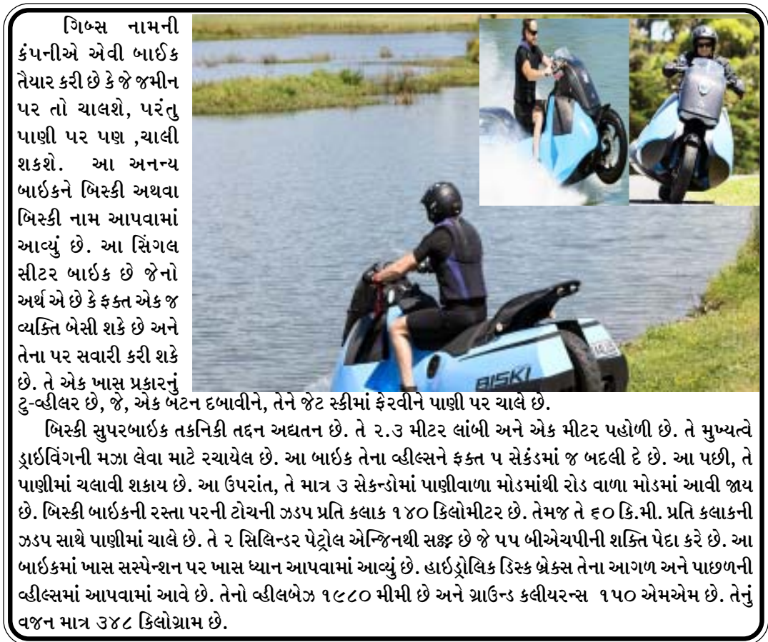
ગિબ્સ નામની કંપનીએ એવી બાઈક તૈયાર કરી છે કે જે જમીન પર તો ચાલશે, પરંતુ પાણી પર પણ ચાલી શકશે. આ અનન્ય બાઈકને બિસ્કી અથવા બિસ્કી નામ આપવામાં આવ્યું છે. આ સિંગલ સીટર બાઈક છે જેનો અર્થ એ છે કે ફક્ત એક જ વ્યક્તિ બેસી શકે છે અને તેના પર સવારી કરી શકે છે. તે એક ખાસ પ્રકારનું ટુ-વ્હીલર છે, જે, એક બટન દબાવીને, તેને જેટ સ્કીમાં ફેરવીને પાણી પર ચાલે છે.

દહેશત ફેલાવવા માટેની વિરોધ પક્ષની ઝુંબેશને અંત આવી ગયો છે. તેમણે દાવો કર્યો હતો કે, ૩૦થી ૩૫ ટકા લઘુમતિ લોકો ભાજપ માટે મત આપનાર છે. નકવીએ કહ્યું હતું કે, ૨૦૧૪માં સત્તા ઉપર આવેલા ભાજપે શાનદાર કામગીરી કરીને તમામ સમુદાયના લોકોનો વિશ્વાસ જીતવામાં સફળતા મેળવી છે. નકવીએ વિશ્વાસ વ્યક્ત કરતા કહ્યું હતું કે, મુસ્લિમ સહિત ૩૫ ટકા લઘુમતિ લોકો ૨૦૧૯માં ભાજપને મત આપશે. તેમણે એમ પણ કહ્યું હતું કે, એનડીએ સરકારે લઘુમતિઓના વિકાસ માટે વ્યાપક કામ કર્યું છે. આ