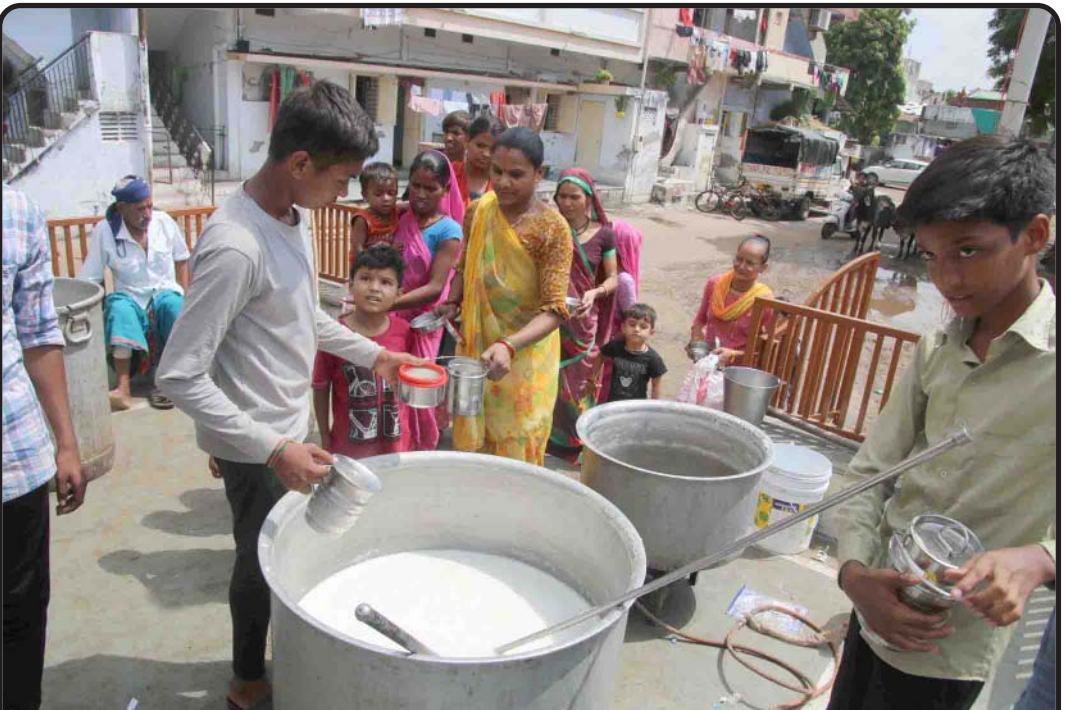
ઠોર નિયંત્રણ કાયદાને લઈ રાજ્યના માલધારી સમાજે સરકાર સામે બાંધ્યો ચઢાવી હતી. ઠોર નિયંત્રણ કાયદો પરત ખેંચવાની માગ સાથે ખુલ્લા મને ચર્ચાઓ કરી હતી. લોકોને મફત દૂધનું વિતરણ પણ કરવામાં આવ્યું હતું.