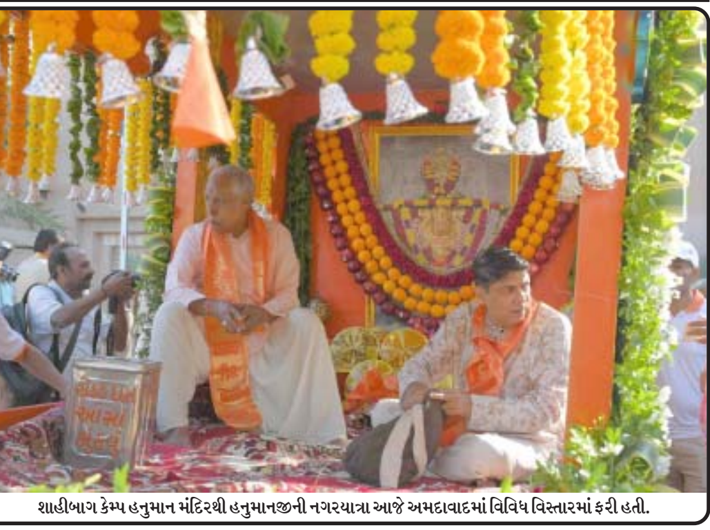
શાહીબાગ કેમ્પ હનુમાન મંદિરથી હનુમાનજીની નગરયાત્રા આજે અમદાવાદમાં વિવિધ વિસ્તારમાં ફરી હતી.

વિશે પણ માહિતી પૂરી પાડે છે. આઈઆઈટી રૂરકીના પૃથ્વી વિજ્ઞાન વિભાગના પ્રોફેસર સુનીલ બાજપાઈએ નિવેદનમાં જણાવ્યું હતું કે, આ સંશોધન માત્ર ભારતની પ્રાચીન ઈકોસિસ્ટમને સમજવા માટે જ નહીં, પરંતુ ભારતીય ઉપખંડમાં સાપના ઉત્ક્રાંતિ ઇતિહાસને જાણવા માટે પણ મહત્વપૂર્ણ છે. તે આપણા કુદરતી ઇતિહાસને જાણવાના મહત્વને રેખાંકિત કરે છે અને આપણા ભૂતકાળના રહસ્યોને ઉકેલવામાં સંશોધનની ભૂમિકા પર પ્રકાશ પાડે છે. આ સંશોધનની પ્રશંસા કરતા આઈઆઈટી રૂરકીના ડિરેક્ટર પ્રોફેસર કે.કે.પંતે કહ્યું હતું કે, અમને પ્રોફેસર સુનિલ બાજપાઈ અને તેમની ટીમ પર આ મહત્વપૂર્ણ સંશોધન કરવા પર ગર્વ છે. વાસુકી ઈન્ડિકસની શોધ આઈઆઈટી રૂરકીની વૈજ્ઞાનિક જ્ઞાનને આગળ વધારવાની પ્રતિબદ્ધતા અને સંશોધનમાં ઉત્કૃષ્ટતાના અમારા સતત પ્રયાસને રેખાંકિત કરે છે. આવા વિજ્ઞાન સંશોધન આપણા ગ્રહના ઇતિહાસ વિશેની આપણી સમજને સમૃદ્ધ બનાવે છે અને ગ્લોબલ સાયન્સના પ્લેટફોર્મ પર આઈઆઈટી રૂરકીનું નામ રોશન કરે છે.