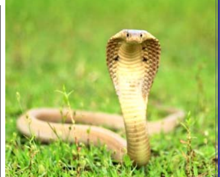
તેનું મૃત્યુ પણ થઈ શકે છે. તેથી જ, તાપમાનમાં વધારો થતાં, સાપ ઠંડી જગ્યાઓની શોધમાં તેમના ઇન્દ્રિયોમાંથી બહાર આવે છે અને રહેણાંક વિસ્તારોની આસપાસ દેખાવા લાગે છે. Sciencedaily.com મુજબ, ઉનાળામાં દરરોજ તાપમાનમાં વધારા સાથે સાપ કરડવાની સંભાવના લગભગ ૬% વધી જાય છે. ભારતમાં દર વર્ષે ૧,૮૦૦થી વધુ લોકો સાપ કરડવાથી મૃત્યુ પામે છે. જો આપણે સાપ કરડવાની ઘટનાઓ અને આંકડાઓ પર નજર કરીએ, તો આપણને જણાય છે કે મોટા ભાગના કેસ એપ્રિલ અને ઓક્ટોબર વચ્ચે નોંધાયા છે. ૮૦ ટકાથી વધુ સાપ કરડવાના કેસો ગ્રામીણ વિસ્તારોમાં થાય છે.

શું તમે ક્યારેય વિચાર્યું છે કે ઉનાળામાં સાપ તેના દરમાંથી કેમ બહાર આવે છે? આ સિઝનમાં સાપ કરડવાના બનાવો કેમ વધે છે? સાપ 'દંડા લોહીવાળા' પ્રાણીઓ છે. આનો અર્થ એ છે કે તેઓ તેમના પોતાના શરીરનું તાપમાન જાળવી શકતા નથી. ઠંડીના દિવસોમાં પૂરતી ઉર્જા ન મળવાને કારણે સાપનું ચયાપચય ખૂબ જ ધીમું થઈ જાય છે, તેથી તેઓ ન તો ઝડપથી દોડી શકે છે અને ન તો શિકાર કરી શકે છે. તેથી જ તેઓ મોટાભાગનો સમય સુવામાં પસાર કરે છે. એકત્રિત કરેલી ઉર્જાનો સંગ્રહ કરવાનો પ્રયાસ કરે છે. પરંતુ જલદી ઉનાળો શરૂ થાય છે અને તાપમાન વધતા તેઓ દરમાંથી બહાર આવે છે. ઉનાળા દરમિયાન સાપને પૂરતી ઉર્જા મળે છે અને તેમનું ચયાપચય વધે છે, તેથી તેઓ અતિસક્રિય બની જાય છે. તેઓ શિકારની શોધમાં બહાર જાય છે અને પ્રજનન પણ કરે છે. નિષ્ણાતોનું કહેવું છે કે તાપમાન વધવાથી સાપનું શરીર પણ ગરમ થવા લાગે છે, જેના કારણે