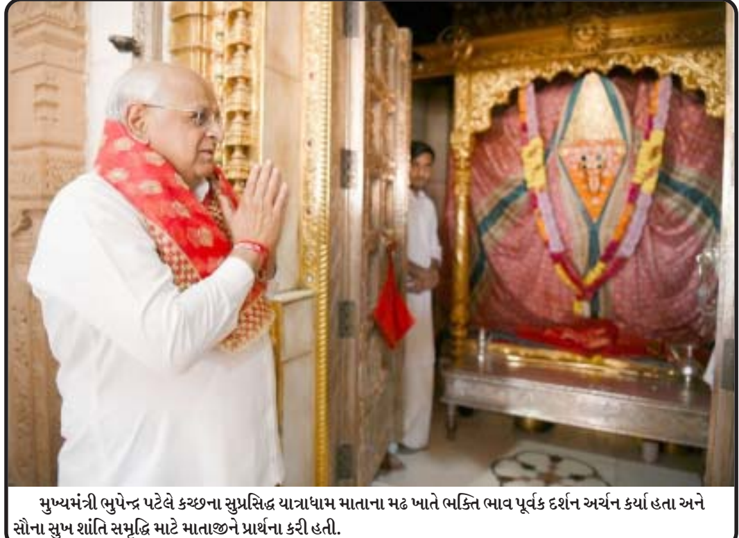
મુખ્યમંત્રી ભુપેન્દ્ર પટેલે કચ્છના સુપ્રસિદ્ધ યાત્રાધામ માતાના મઢ ખાતે ભક્તિ ભાવ પૂર્વક દર્શન અર્ચન કર્યા હતા અને સોના સુખ શાંતિ સમૃદ્ધિ માટે માતાજીને પ્રાર્થના કરી હતી.

નહીં જાય. ૨, ૮ અને ૧૬ મેના રોજ વિશાખાપટ્ટનમથી ચાલતી ટ્રેન નં ૨૦૮૦૩ વિશાખાપટ્ટનમ, ગાંધીધામ એક્સપ્રેસ ટ્રેન તેના નિર્ધારિત માર્ગ વિશાખાપટ્ટનમ, વિજયવાડા, બલ્હારશાહ, બંડરના, વર્ધાના સ્થાને તેના ડાયવર્ટ કરાયેલા માર્ગ વાયા વિશાખાપટ્ટનમ, વિજયનગરમ, રાયગઢ, ટિટલાગઢ, રાયપુર, વર્ધાના માર્ગ પર દોડશે. આ ટ્રેન દુલ્લાડા, સામલકોટ, રાજમુડી, એલુર, વિજયવાડા, ખમ્મમ, વારંગલ, રામગુંડમ, સિરપુર કાગળનગર, બલ્હારશાહ, ચંદ્રપુર સ્ટેશનો પર નહીં જાય. ૧, ૮ અને ૧૫ મેના રોજ ઓખાથી ચાલતી ટ્રેન નં ૨૦૮૨૦ ઓખા-પુરી એક્સપ્રેસ ટ્રેન તેના નિર્ધારિત માર્ગ વર્ધા, બલ્હારશાહ, વિજયવાડા, રાયપુર, ટિટલાગઢ, રાયગઢ, રાયમગરમ, વિશાખાપટ્ટનમના માર્ગ પર દોડશે. આ ટ્રેન દુલ્લાડા, સામલકોટ, રાજમુડી, એલુર, વિજયવાડા, ખમ્મમ, વારંગલ, રામગુંડમ, સિરપુર કાગળનગર, બલ્હારશાહ, ચંદ્રપુર સ્ટેશનો પર નહીં જાય. ટ્રેનોના સ્ટોરેજ, રૂટ અને સમય વિશે વિસ્તૃત માહિતી માટે તમે www.enquiry.indianrail.gov.in ની મુલાકાત લઈ શકો છો.