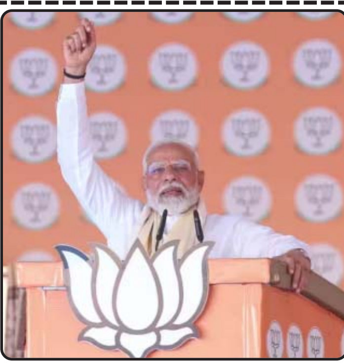
ચારેતરફ ભારતની પ્રશંસા થઈ રહી છે. આજે દેશમાં ભાજપની સરકાર છે, જે ન

પ્રતિનિધિ દ્વારા દમોહ, તા. ૧૯ મધ્યપ્રદેશના દમોહમાં એક ચૂંટણીસભાને સંબોધતા વડાપ્રધાન મોદીએ, પાકોશી દેશ પાકિસ્તાન પર જોરદાર પ્રહારો કર્યા હતા. પીએમ મોદીએ કહ્યું કે, જે દેશ આતંકવાદનો સપ્લાયર છે તે આજે લોટ મેળવવા માટે તડપી રહ્યું છે. તેમણે કહ્યું કે હાલમાં વિશ્વમાં યુદ્ધનું વાતાવરણ સર્જાયું છે. વિશ્વમાં યુદ્ધના વાદળો છવાયા છે. સર્વત્ર અશાંતિ છે. આવી સ્થિતિમાં આપણું ભારત વિશ્વમાં સૌથી ઝડપથી વિકાસ કરી રહ્યું છે. વડાપ્રધાને કહ્યું કે, જ્યારે વિશ્વમાં યુદ્ધનું વાતાવરણ છે ત્યારે દેશમાં મજબૂત સરકાર હોવી જરૂરી છે. આ ચૂંટણી ભારતને મહાસત્તા બનાવવા માટેની ચૂંટણી છે. આ ચૂંટણી ભારતના ભવિષ્યને ઉજ્જવળ કરવા માટેની ચૂંટણી છે. આવાસી પેઢીના ભવિષ્યને સુરક્ષિત કરવા માટે આ ચૂંટણી છે. આજે વિશ્વમાં