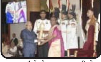
આગળ રહ્યું છે. તેમના પ્રદાન થકી એસ. જિંદાલ ચેરિટીબલ ફાઉન્ડેશન, અનેક ટ્રસ્ટો, હોસ્પિટલો, સ્કૂલો અને કોલેજોનું નિર્માણ થયું છે જે તેમની સેવાઓ પ્રત્યે તેમના અત્યુત્ક્રમ દર્શાવે છે.

એજન્સી દ્વારા સપાત્રતા કાર્યો અને હેલ્થકેરમાં દૂરદેશી ધરાવતા અગ્રણી ડો. સીતારામ જિંદાલને સોમવારે નવી દિલ્હીમાં રાષ્ટ્રપિત ભવન ખાતે ભારતના રાષ્ટ્રપતિ દ્વારા પ્રતિષ્ઠિત પદ્મભૂષણ એવોર્ડથી સન્માનિત કરવામાં આવ્યા હતા. આ પ્રસંગે વડાપ્રધાન અને અન્ય પ્રતિષ્ઠિત હસ્તીઓ પણ ઉપસ્થિત રહી હતી. આ કાર્યક્રમ સમાજ પ્રત્યે ડો. જિંદાલના અદિતીય પ્રદાનને માન્યતા આપતો યાદગાર પ્રસંગ બની રહ્યો હતો. ૧૨ સપ્ટેમ્બર, ૧૯૭૨ના રોજ હરિયાણાના નાલવા ગામમાં જન્મેલા ડો. સીતારામ જિંદાલની સફર પ્રેરણાદાયી છે. જિંદાલ એલ્યુમિનિયમ લિમિટેડ (જેએએલ)ના ફાઉન્ડર ચેરમેન તરીકે તેમની ઉદ્યોગસાહસિક કુશળતા ભારતના સૌથી મોટા એલ્યુમિનિયમ એક્સપોર્ટર મેચ્યુરેક્ટર બનાવવામાં મહત્વપૂર્ણ રહી છે. આમ છતાં તેમનું વિજન બિઝનેસથી