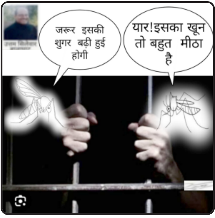
જરૂર ઇસકી શુગર બઢી હુઈ હોગી. યાર! ઇસકા યુન તો બહુત મીઠા હૈ.