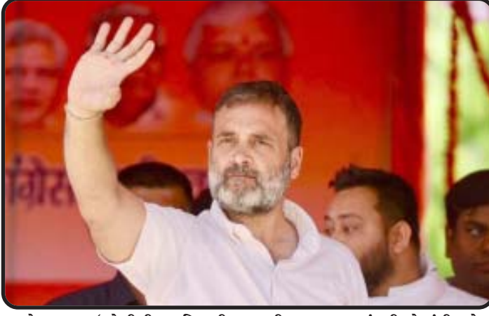
પૈસા લોકોને આપવામાં આવશે. મને પછાત શબ્દ પણ ગમતો નથી. આનો અંત આવવો જોઈએ. અમારી સરકાર આવશે તો અમે વિચારીશું ભાજપ ઈચ્છે છે કે SC-ST, OBC સમુદાયના લોકો તેમના ઈતિહાસને ઓળખે નહીં. તમને ભૂતકાળથી કાપી નાખવામાં આવ્યા છે. દુલેહ અને આંબેડકરજી જેવા કરોડો લોકો હતા, જેમણે દેશ માટે ૨૪ કલાક પોતાનું લોહી અને પરસેવો આપ્યો, પરંતુ તેમના વિશે કોઈ બોલવું નથી. સ્વાતંત્ર્ય સંગ્રામમાં પણ આ સમુદાયના લોકોની કેન્દ્રીય ભૂમિકા હતી, પરંતુ તેની કોઈ ચર્ચા નથી. દેશની સરકાર અને રાજ્ય સરકારો પાક વીમા યોજના માટે ૪૫ હજાર કરોડ રૂપિયા આપે છે. તેના પૈસા ૧૬ કંપનીઓને જાય છે. તેમના માલિકોમાં એક પણ દલિત-ઓબીસી નથી. પછી જ્યારે વાવાઝોડ આવે છે ત્યારે ખેડૂતોનું ખેતર નાશ પામે છે. ત્યારે આ કંપનીઓ કહે છે કે તમારા ખેતરમાં કોઈ ખોટ નથી. એટલે કે GST દ્વારા ગરીબો પાસેથી પૈસા લઈને તે એવા લોકો સુધી પહોંચ્યા જેઓ દલિત-ઓબીસી નથી. એવું ન વિચારો કે જાતિ ગણતરી માત્ર કાસ્ટ સર્વે છે, તેમાં આર્થિક અને સંસ્થાકીય સર્વે પણ ઉમેરવામાં આવશે. જેથી દરેકને ખબર પડશે કે કઈ જાતિના લોકોની વેટલી આવક છે અને વિવિધ સંસ્થાઓમાં તેમની કેટલી ભાગીદારી છે. એક રીતે, તેને રાષ્ટ્રીય એક્સ-રે ગણો. મને આશ્ચર્ય થાય છે કે આજાદીના ૭૦ વર્ષ પછી આજે દેશની સ્થિતિ છે.