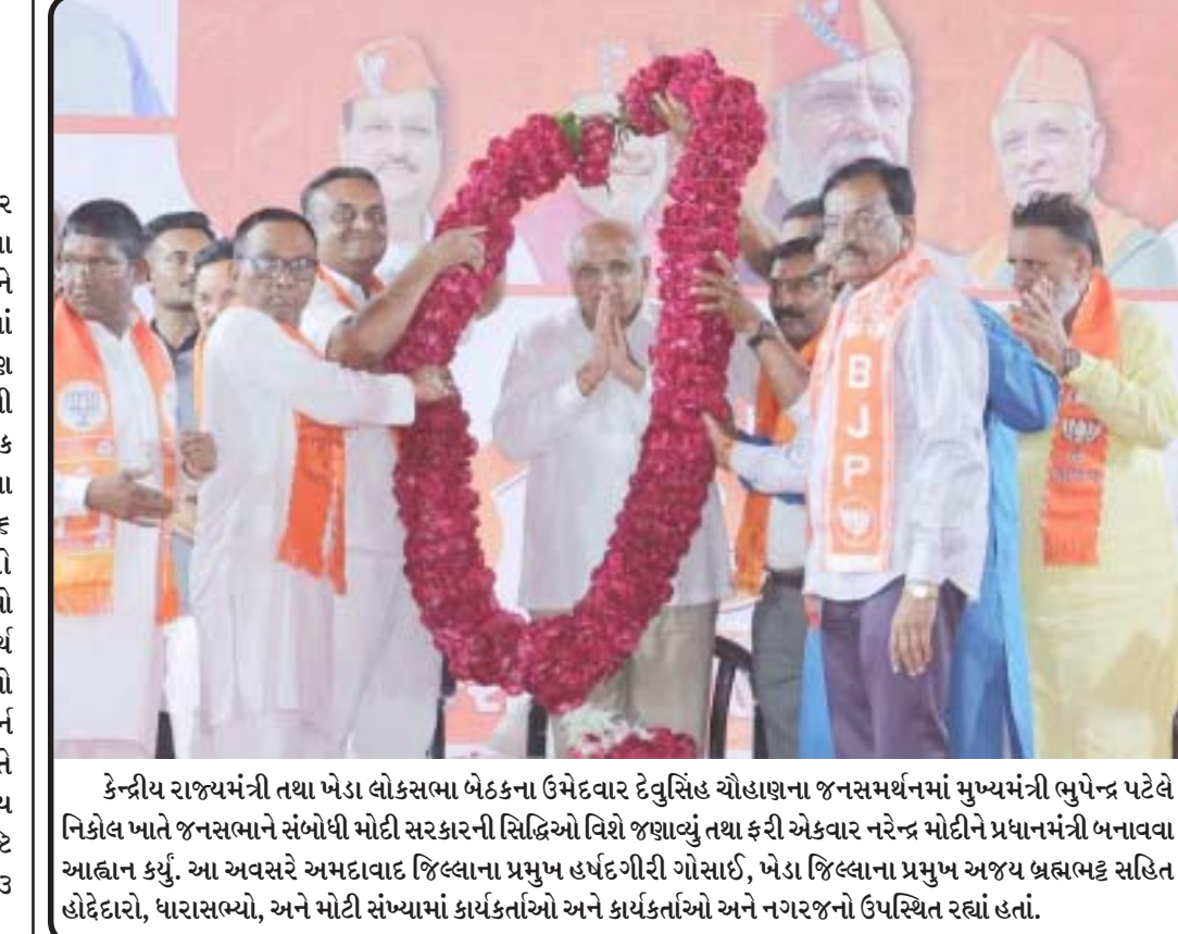
કેન્દ્રીય રાજ્યમંત્રી તથા ખેડા લોકસભા બેઠકના ઉમેદવાર દેવેસિંહ ચૌહાણના જનસમર્થનમાં મુખ્યમંત્રી ભુપેન્દ્ર પટેલે નિકોલ ખાતે જનસભાને સંબોધી મોટી સરકારની સિદ્ધિઓ વિશે જણાવ્યું તથા ફરી એકવાર નરેન્દ્ર મોદીને પ્રધાનમંત્રી બનાવવા આહ્વાન કર્યું. આ અવસરે અમદાવાદ જિલ્લાના પ્રમુખ હર્ષદગીરી ગોસાઈ, ખેડા જિલ્લાના પ્રમુખ અજય બ્રહ્મભટ્ટ સહિત હોદેદારો, ધારાસભ્યો, અને મોટી સંખ્યામાં કાર્યકર્તાઓ અને નગરજનો ઉપસ્થિત રહ્યાં હતાં.

નાના વરઘોડામાં રહેતો ૭ વર્ષીય બાળક લગ્નના વરઘોડામાં બાળકોની ભીડ વચ્ચે ડાન્સ કરી રહ્યો હતો. ત્યારે મહોલ્લામાં જ રહેતો ૧૬ વર્ષીય સગીર તેની પાસે આવ્યો હતો અને ચાલતાં ચાલતાં જઈએ તેમ કહીને તેને અવારનું જગ્યા તરફ લઈ ગયો હતો. અહીં બાળકને ધામધમકી આપી તેની સાથે સૃષ્ટિ વિરૂદ્ધનું કૃત્ય આચર્યું હતું. ભયભીત બાળક જ્યારે ઘરે