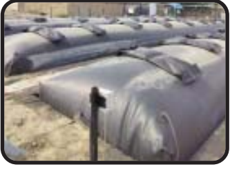
બાયો ડાયવેસ્ટર્સ પંજાબ અને હરિયાણાના ૨૪ જિલ્લાઓમાં સ્થાપવાની પ્રક્રિયા હાથ ધરી છે. નાના ડેરી ફાર્મ કે જ્યાં પશુઓના છાણને ખુલ્લા મુકી દેવામાં આવે છે તે સ્થળો સ્ત્રાવના અગત્યના સ્ત્રોત તરીકે ઉભરી આવ્યા છે. એક વખત બાયોડાયવેસ્ટરમાં મુકવામાં તે પછી છાણનું માઈક્રોબાયલ બ્રેકડાઉન થાય છે અને બાયોગેસ ઉત્પન્ન કરે છે.

એજન્સી દ્વારા નેસ્લે ઇન્ડિયા 'બાયોડાયવેસ્ટર પ્રોજેક્ટ' સાથે જવાબદાર પૂર્ણ પ્રાપ્તિ અને ડેરી ફાર્મમાંથી પેદા થતા સ્ત્રાવમાં ઘટાડો કરવાની પોતાની અડગ પ્રતિબદ્ધતાનું પ્રદર્શન કરી રહી છે. બાયોડાયવેસ્ટર ટેકનોલોજી પશુઓના છાણને ચોખ્ખા બાયોગેસમાં પ્રસ્થાપિત કરે છે, જે ડેરીફાર્મમાંની કાર્બનની હાજરીમાં ઘટાડો કરે છે. શેષ રહેલી સ્વચ્છ અને કુદરતી ખાતર તરીકે ઉપયોગ થાય છે જેના દ્વારા પુનઃઉપાર્જિત કૃષિ પ્રેક્ટીસમાં યોગદાન આપે છે. આ પહેલા ભાગરૂપે નેસ્લે ઇન્ડિયાએ લગભગ ૭૦ મોટા બાયોડાયવેસ્ટર અને ૩,૦૦૦ નાના એજન્સી દ્વારા બાયો ડાયવેસ્ટર્સ પંજાબ અને હરિયાણાના ૨૪ જિલ્લાઓમાં સ્થાપવાની પ્રક્રિયા હાથ ધરી છે. નાના ડેરી ફાર્મ કે જ્યાં પશુઓના છાણને ખુલ્લા મુકી દેવામાં આવે છે તે સ્થળો સ્ત્રાવના અગત્યના સ્ત્રોત તરીકે ઉભરી આવ્યા છે. એક વખત બાયોડાયવેસ્ટરમાં મુકવામાં તે પછી છાણનું માઈક્રોબાયલ બ્રેકડાઉન થાય છે અને બાયોગેસ ઉત્પન્ન કરે છે. નાના બાયોડાયવેસ્ટર બાયોગેસ ઉત્પન્ન કરી શકે છે જે એલપીજી અને લાકડાના ઈંધણનું સ્થાન લઈ શકે છે, જે સ્વાસ્થ્ય સંબંધિત ધૂમાડાના જોખમોને ઘટાડે છે ત્વરિત નાણાકીય લાભો આપે છે. આ લાભો ઉપરાંત મોટા બાયોડાયવેસ્ટર્સ વીજળી પણ ઉત્પન્ન કરવા સક્ષમ છે જે ૧૦૦% પુનઃપ્રાપ્ય છે, આમ પર્યાવરણ પર સકારાત્મક રીતે અસર કરે છે. બાયોડાયવેસ્ટર્સમાં રહેલા શેષ છાણને જૈવિક ખાતરમાં રૂપાંતરીત કરવામાં આવે છે જેનો વપરાશ ખેતરોમાં અને કિચન ગાર્ડનમાં થાય છે. આ પહેલ અંગે ટિપ્પણી કરતાનેસ્લે ઇન્ડિયાના કોર્પોરેટ એક્ઝેક્યુટિવ અને સસ્ટેનેબિલિટીના ડિરેક્ટર