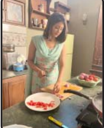
તેની સિંગલ માતાને નજીક લાવી શકશે...? પ્રસિદ્ધ અભિનેત્રી ઉલ્કા ગુપ્તા આ પાત્ર કરવા માટે પોતાની અલગ જ રીતે આગળ વધી રહી છે, જેથી કરીને તે યોગ્ય રીતે જાનવીનું પાત્ર કરી શકે. સિંગલ મધરનું જીવન જીવવા તથા બધું પોતાની જાતે

એજન્સી દ્વારા ઝી ટીવીના આગામી શો-મૈ હું સાથ તેરે તૈયાર છે, દર્શકોને એક સિંગલ મધર જાનવી (ઉલ્કા ગુપ્તા)ની વાર્તા દર્શાવવા માટે, જે હાલમાં માતા-પિતા તરીકેની બેગણી જવાબદારી નિભાવી રહી છે. ગ્વાલિયરની પાશ્ચાત્ય પર આધારીત જાનવીનું જીવન તેના ટિકરા કિયાન (નિહાન જૈન)ની આસપાસ ફરે છે, તેના માટે તે પૂરી ડુનિયા છે. તેમના સંબંધની મજબૂતી છતા પણ, કિયાનને ઘરમાં પુરુષની કમી લાગે છે, પણ તેની માતાના દ્રષ્ટિકોણથી જોઈએ તો, તે બધું જ એકદુ સંભાળી શકે છે. વાર્તામાં વર્ણવે ત્યારે આવે છે, જ્યારે ધનાઢ્ય બિઝનેસમેન આર્યમાન જાનવીને મળે છે અને તેઓ બંને એક જ છત હેઠળ કામ કરે છે. આર્યમાનને જાનવીમાં રસ છે, શું કિયાન તે બંનેને મેળવી શકશે અને તેની માતાને જે વ્યક્તિ પસંદ કરે છે, તેનાથી એજન્સી દ્વારા સ્વતંત્રતાપૂર્વક કરવા માટે ઉલ્કા પોતાના ઘરના કામ કોઈ પણ જાતના કામવાળાની મદદ વગર જાતે કરી રહી છે. તે માને છે કે, આનાથી તેનું વર્તનમાં એટલો બદલાવ આવશે કે, આ જ પ્રવૃત્તિ તે સ્કીન પર સારી રીતે કરી શકશે. ઉલ્કા ગુપ્તા કહે છે, “હું ખૂબ જ નાની છું અને હું હજી માતા પણ નથી બની, તો મને એક માતા ઘરમાં કઈ રીતે બધું કામ કરે છે, તે મને જરા પણ નથી ખબર. એક સ્વતંત્ર માતાના શારીરિક લક્ષણોને આત્મસાત કરવાના દ્રષ્ટિકોણથી મેં મારા ઘરની આસપાસનું બધું જ કામ જાતે જ કર્યું છે, તો મને લાગ્યું કે, મારે એવું જાણવું પડ્યું કે મહિના સુધી મારે મારા ઘરનું કામ જાતે કરવું જોઈએ. જ્યારે કોઈ સ્ત્રી ફ્લોર સફાઈ કરે છે કે રસોઈ કરતી હોય ત્યારે તેના પર દુપટ્ટો બાંધે છે કે માથા પર તેનો બન બાંધે છે, તો આ બધી એક ચોક્કસ અનિયમિતતા હોય છે, આ બધું કોઈ શિખરનું નથી.