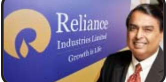
ગયા નાણાકીય વર્ષના ચોથા ક્વાર્ટરમાં, કંપનીએ ૧૯,૨૯૯ કરોડ રૂપિયાનો નફો કમ્પાઉન્ડ નાણાકીય વર્ષ ૨૦૨૪ના ચોથા ક્વાર્ટરમાં RILની આવક ત્રિમાસિક ધોરણે ૩.૨૨ લાખ કરોડથી વધીને ૩.૨૭ લાખ કરોડ થઈ છે. વાર્ષિક ધોરણે તે ૨.૧૩ લાખ કરોડ રૂપિયાથી વધીને ૨.૩૭ લાખ કરોડ રૂપિયા થઈ ગયો છે. નાણાકીય વર્ષ ૨૦૨૪ ના ચોથા ક્વાર્ટરમાં RILનો EBITDA ત્રિમાસિક ધોરણે ૪૦,૬૫૬ કરોડથી વધીને ૪૨,૫૧૬ કરોડ થયો છે. નાણાકીય વર્ષ ૨૦૨૪ના ચોથા ક્વાર્ટરમાં, કંપનીનો EBITDA ૩૮,૪૪૦ કરોડ રૂપિયા હતો. FY 2024 ના ચોથા ક્વાર્ટરમાં RILનું EBITDA માર્જિન ત્રિમાસિક ધોરણે ૧૮.૧ ટકાથી ઘટીને ૧૮ ટકા થયું છે.